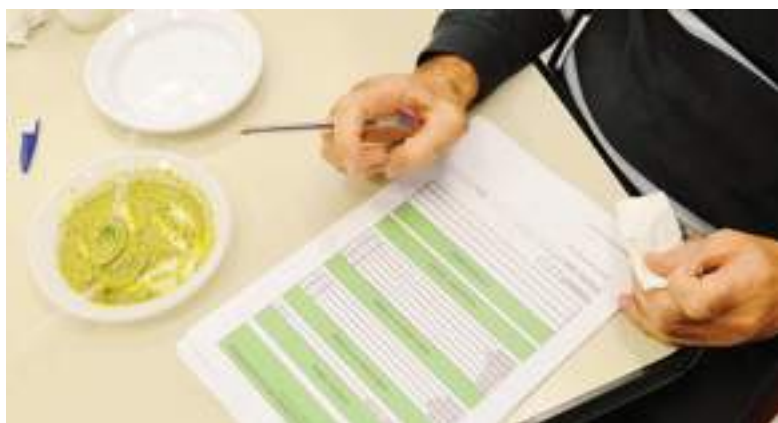
Un giurato compila la scheda di valutazione

ERA L'ESTATE del 2002, il Secolo XIX scese in campo a tutela del vero pesto genovese. Si scoprì infatti che la multinazionale Nestlé aveva ottenuto il brevetto su due semi di basilico (ingrediente essenziale del pesto), registrandoli coi nomi di "Pesto" e "Sanremo": il dubbio - o forse più - fu che i consumatori potessero cadere in confusione. A ridosso del Ferragosto di quell'anno i Nas dei carabinieri denunciarono otto aziende (Nestlé-Buitoni, Barilla, Star, Giesse, Golden Fresh, Pam Food e Crema Lombardi) per frode in commercio, perché avrebbero "immesso sul mercato un prodotto preparato con alcuni ingredienti non previsti nella ricetta del Pesto alla Genovese (ricetta depositata alla Camera di Commercio di Genova)" e per vendita di prodotti industriali con segni mendaci perché, "sulle confezioni compaiono un mortaio di marmo, un pestello di legno o alcune foglie di basilico. Disegni o fotografie che possono trarre in inganno il cliente sull'origine, la provenienza o la qualità del prodotto che è industriale e non artigianale". E la battaglia fu vinta.